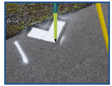
Flecha en Puntos de Control Terrestre